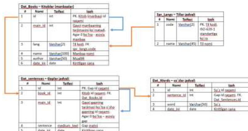
1-rasm. Ma'lumotlar bazasi ER diagrammasi